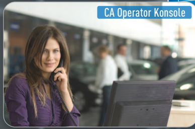
CA Operator Konsole

REZEPTIONISTIN NIMMT KUNDENANRUF ENTGEGEN