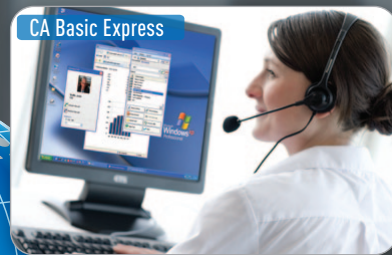
CA Basic Express